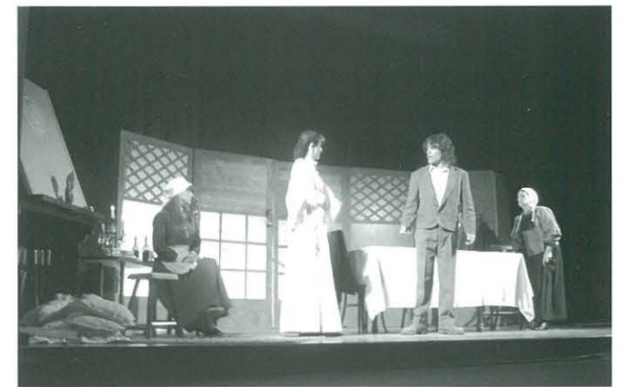
Obra de Teatre "La Dama enamorada", representació a càrrec del Grup Teatral de Móra d'Ebre

Finalment va acabar la Diada del Soci amb la representació de la peça teatral "La Dama enamorada" de Joan Puig i Ferrater, obra posada en escena pel Grup Teatral de Móra d'Ebre.