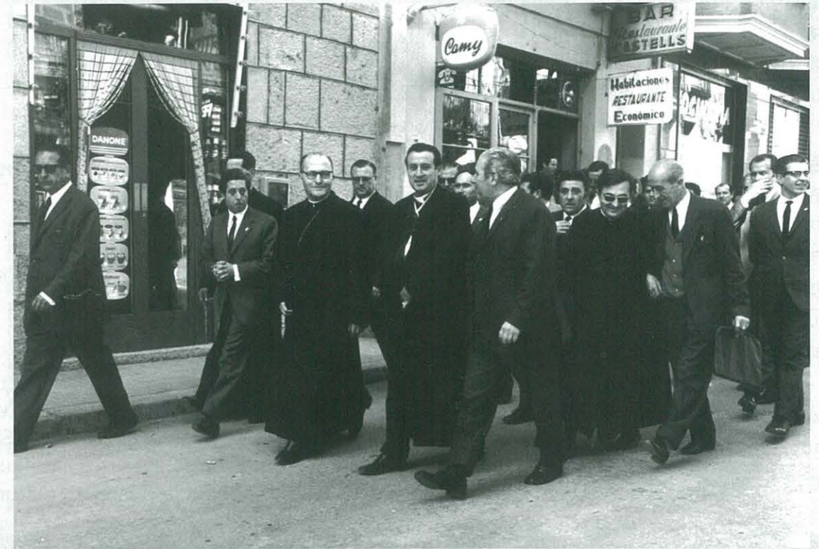
Visita a Ulldecona de l'Arquebisbe Pons y Gol i el Bisbe Ricard M a Carles